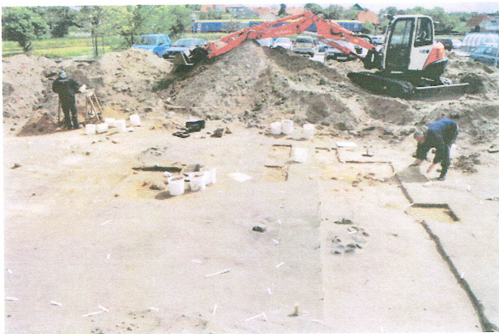
Her er det lidt tidligere i udgravningsforløbet. Det centrale ildsted er kun delvis fritlagt, men man kan se de hvide mærkater og de kvadratiske huller.