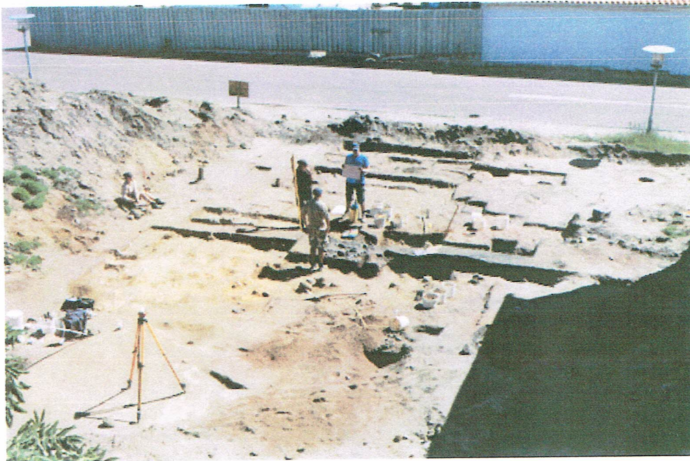
Udgravningsområdet set lidt fra oven. Bemærk de hvide mærker, de markerer et net af kvadratiske huller, som er 50cm x 50 cm store.