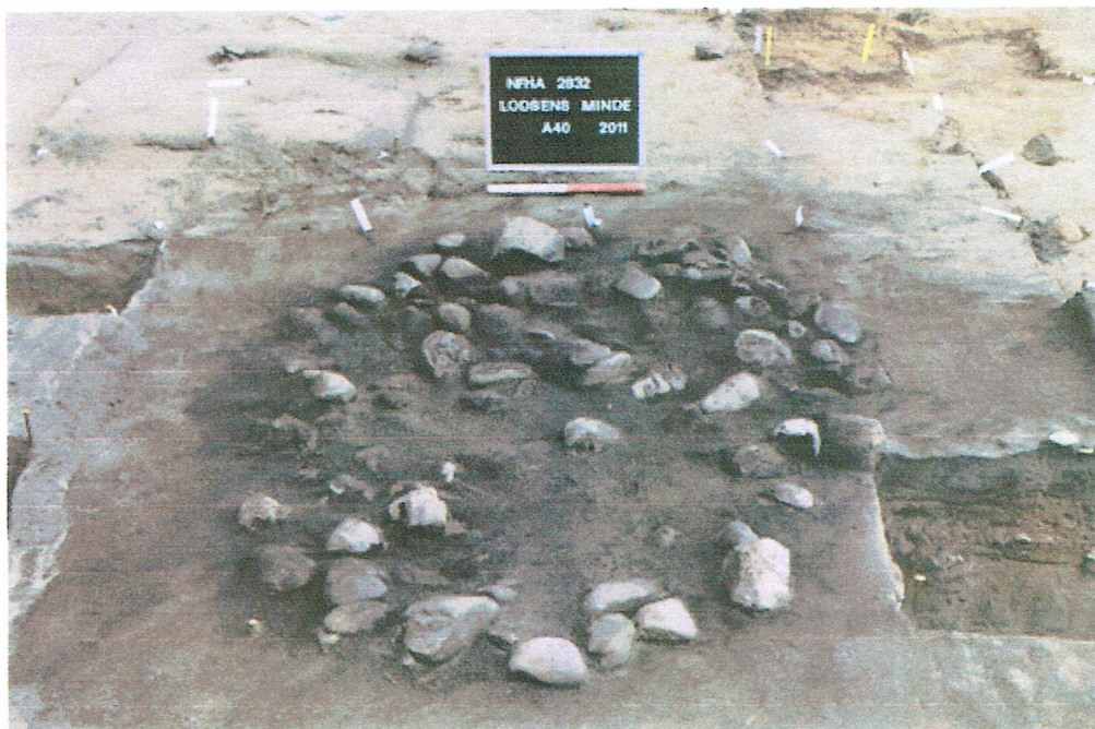
Det centrale stensatte ildsted, som det tog sig ud 1½ måned senere.

At bopladsen er så velbevaret frem til i dag skyldes hovedsagligt meget heldige omstændigheder, eftersom at den oprindelige Lodsens minde i sin tid fik en gårdhave af pigsten. Denne belægning blev lagt direkte ovenpå bopladsen og derfor bevaret den frem til i dag eftersom den har været fuldstændig uberørt indtil vi kom og fjernede den. Det er meget heldigt og fuldstændig fantastisk!