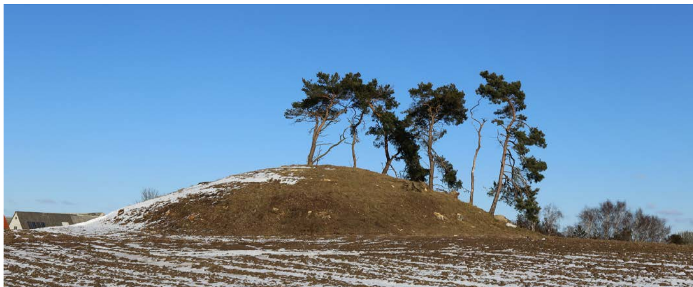
Bomhøj, syd for Store Havelsevej 145, er et godt eksempel på rydning af træer og buske, så gravhøjen for første gang i mange år faktisk kan erkendes af forbigående.

Foreningens forslag er blevet positivt modtaget, og vi har håb om, at der arbejdes videre med dem.