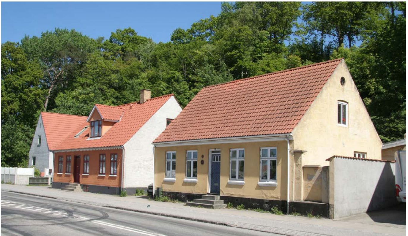
Nørregade 46 og 48 i Frederiksværk. Eksempel på bygninger med SAVE 4 vurdering.

Efter drøftelse med de to nævnte politikere, er det tanken, at sagen om de bevaringsværdige bygninger rejses på ny, og der forventes nu at være flertal for at erklære bygninger med SAVE-karakter 1-4 bevaringsværdige.