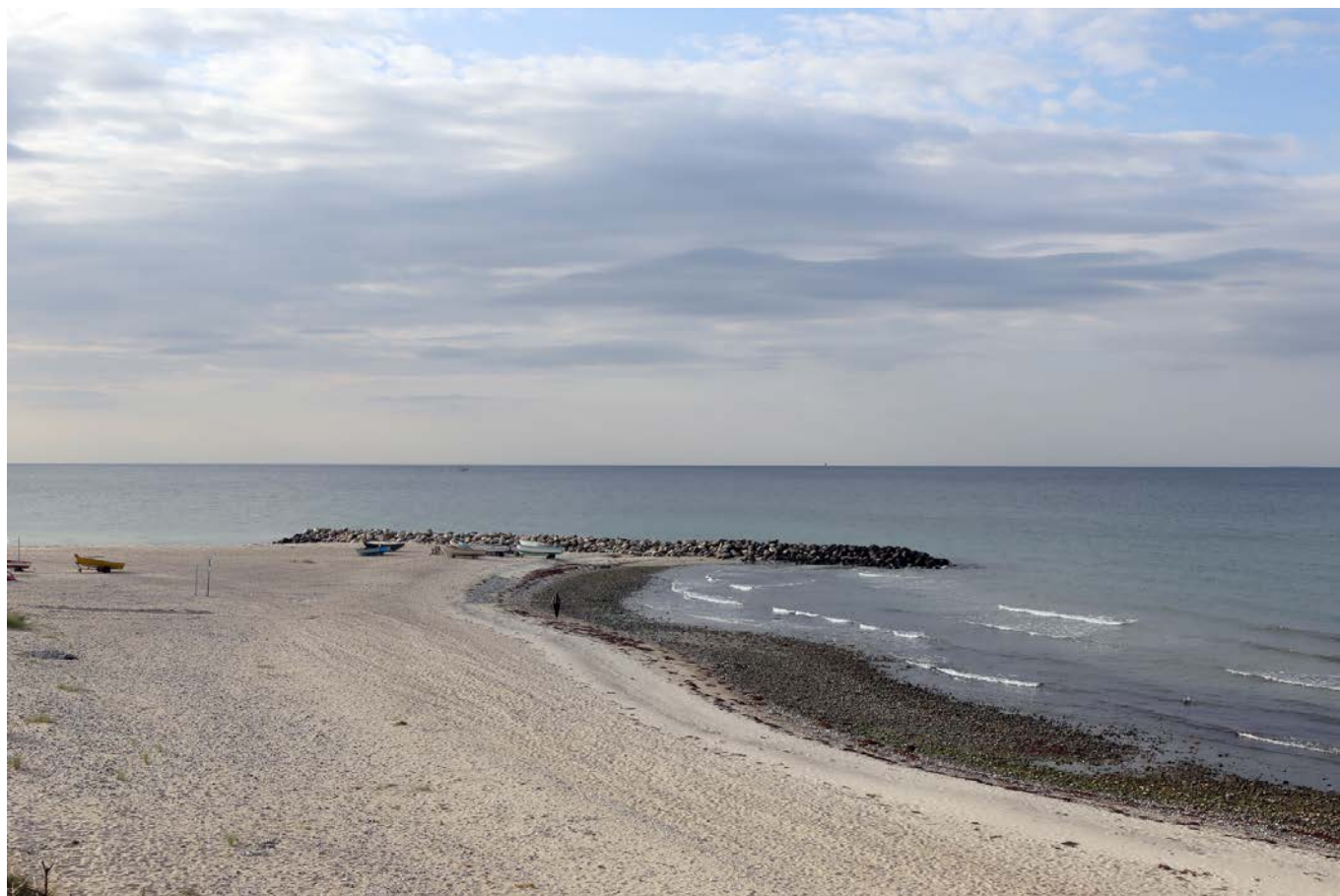
Grønt råd spillede en meget aktiv rolle da det lykkedes at bevare strandbeskyttelseslinjen ved Liseleje Strand, hvilket formentlig betyder, at der ikke kan etableres en havn der.

Repræsentanter fra bestyrelsen deltager normalt i Kulturelt Samråd møder – herunder det årlige repræsentantskabsmøde.